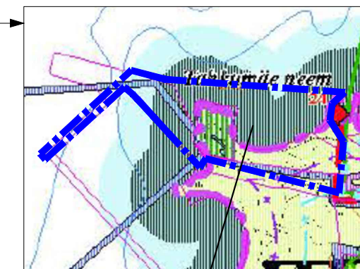
Planeeritud ala asukoht

* Ülejäänud tingmärgid ühtivad Jõelähtme valla üldplaneeringu tingmärkidega